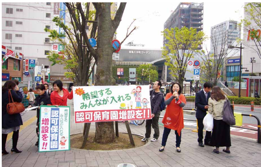
認可保育園を求める署名が始まっています。4月10日大井町にて新日本婦人の会