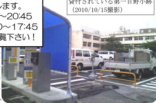
時間貸し駐車場として暫定貸付されている第一日野小跡 (2010/10/15撮影)

この問題で議会質問します。 10/27(水) 20:00~20:45 10/30(土) 17:00~17:45 ケーブルTV放映。ご覧下さい!