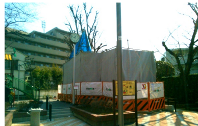
そよかぜ公園の調査 (2/24)

園で行われているボーリング調査の目的は何か、大深度地下トンネルと言うが土地売買の際の地上への影響が心配が出されているが、影響はあるのか、と聞きました。区は、調査の目的は「掘削の詳細設計を行うため」、地上への影響については「今後近隣の住民に説明を行う予定と聞いている」と答えました。その説明会が5月10日行われます。皆で参加し徹底して聞きましょう。