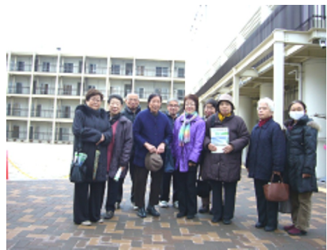
八潮南特養ホーム前で

12月14日に地域のみなさんと、5月にできたばかりの品川区立八潮南特別養護老人ホームの見学をしました。 中学校を改修した施設です。一教室を、3つと4つに区切って個室をつくり、団らん場所として食堂が配置されています。