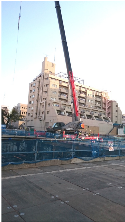
開発地域からを見たユニーブル

ユニーブルマンションの方から声がかかり、工事現場の中を視察してきました。9000㎡と広大な敷地の地下2階深く掘り下げられ、残土搬出に続き、コンクリート打設が始まります。ミキサー車は日に最大120台、残土搬出は日に100台でしたから、今後車両往復が更に激しくなり、一番通り、親友会通りから46号線まで、地域の負担は大変です。