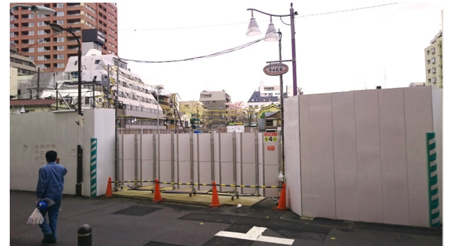
武蔵小山駅前から見た開発地域