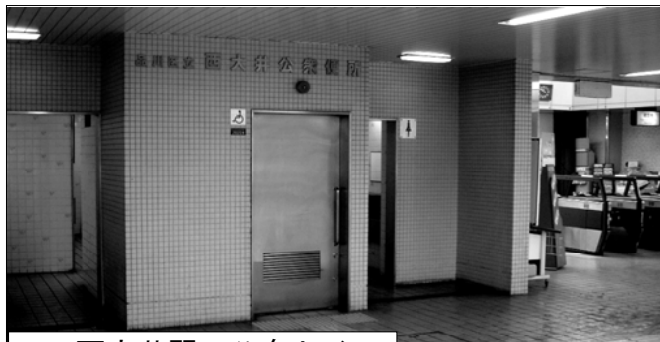
JR西大井駅の公衆トイレ