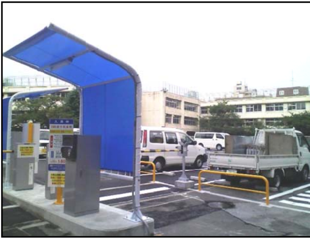
学校の校庭が時間貸しコインパーキングに。後ろに旧第一日野小学校の校舎が見えます。 10月15日撮影

第一日野小学校が今年4月に移転。学校跡地の活用計画について、品川区は(株)テオーシーの駐車場として貸し出しを開始しました。 共産党は「貴重な公共の土地はTOCの駐車場でなく、特養ホームや保育園の建設など住民要望こそ第一にすべき」と主張。計画を白紙に戻すよう求めています。