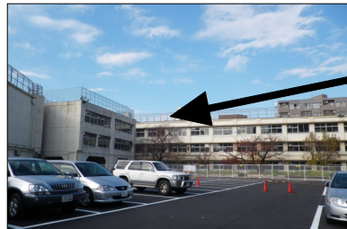
第一日野小学校の旧校舎

第一日野小跡地には、そのまま保育園として活用できる旧幼稚園舎（写真右下）もあります。特養ホームや公園の希望も多く寄せられているのに、一企業の都合を優先とはおかしいです。