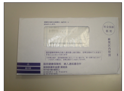
郵送された納入通知書。区役所の国保・窓口では、この紫色の封筒をもった人がずらっと。座るところが足りずパイプが補充されていました。

一方で「値上がったのかどうか、わからない」との声も。今年度の通知書に、昨年度の国保料の金