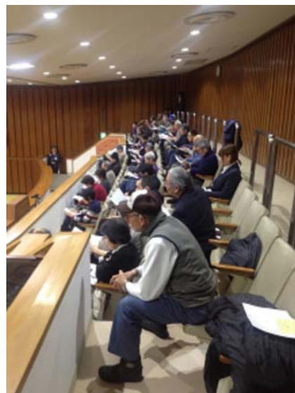
本会議の傍聴席の様子

空きとなる関係から、そもそも認可に入れない今年度の場合、その空きは厳しい状況です。