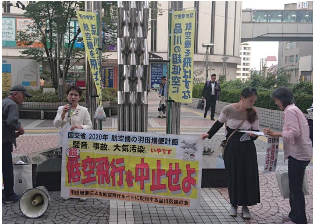
計画に「反対する区民の会」メンバーと大井町駅前です署名活動(8日午後3時)

2016年10月16日(日) NO503 区議控室 TEL 5742-6818 事務所 大井3-19-7-101 TEL 3773-3231