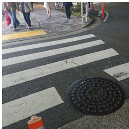
大井町駅踏み切り近くのマンホール