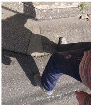
西大井4丁目 住宅地の段差