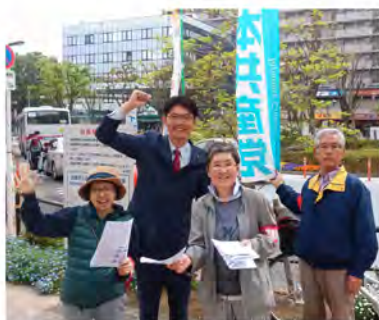
西大井駅前、大井町駅前にて街頭より区政報告。見かけましたらお気軽にお声をおかけ下さい。