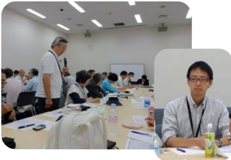
国交省に質問する品川連絡会代表。国会議員と白石都議も参加しました。