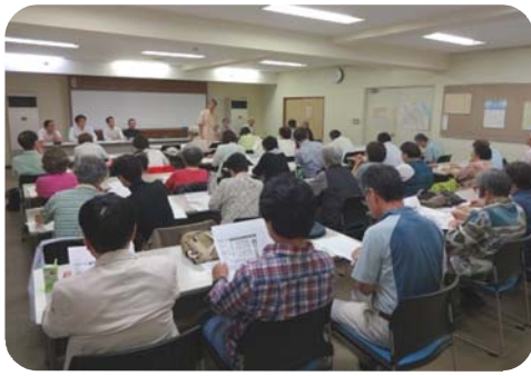
八潮の方が「迫ってくる恐怖を感じた」と体験を発言、報告会は46人参加