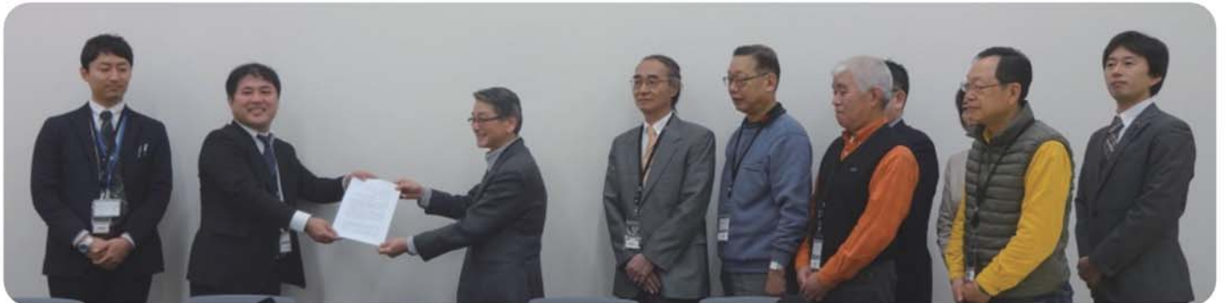
▲国交省の担当者(左)に要請文を手渡す低空飛行ルートに反対する区民の会の方々(右)。小池晃、田村智子両参院議員、白石たみお都議会議員も参加しました。

12月24日、「羽田増便による低空飛行ルートに反対する品川区民の会」が国交省に直接要請しました。