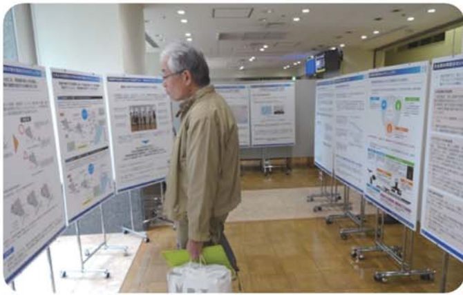
▲大田区役所での国交省2回目の説明会