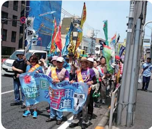
▲5月7日、核兵器廃絶と平和を求めて国民平和大行進。聖跡公園〜鈴ヶ森公園まで歩きました。