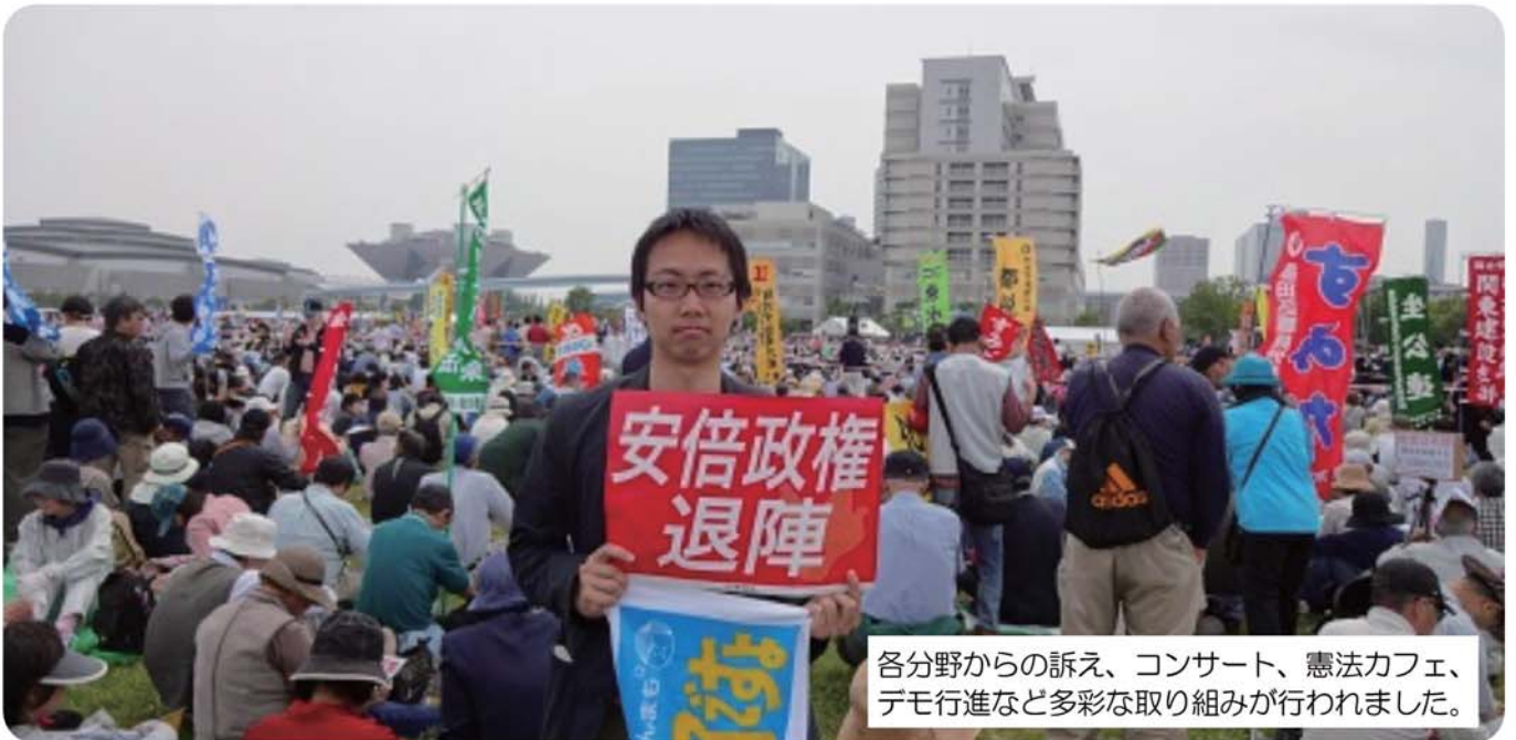
各分野からの訴え、コンサート、憲法カフェ、デモ行進など多彩な取り組みが行われました。

GWのなか日、5月3日の憲法記念日に江東区の公園で開かれた憲法集会に参加しました。