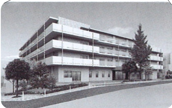
▲上大崎3丁目特養ホームのイメージ図

特養ホームを「もうつくらない」という2000年の区の方針を転換させ11年ぶりに八潮に増設させてから5か所目です。昨年5月に平塚橋（100人）が開設され、今年6月には上大崎3丁目（102人）にも特養ホームが開設。申請は2月末が締め切りです。