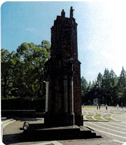
▶原爆で焼け残った建物(長崎)。

条約は核の開発や実験、貯蔵だけでなく、他国の核を自国に移転することや配備を許可すること、禁止事