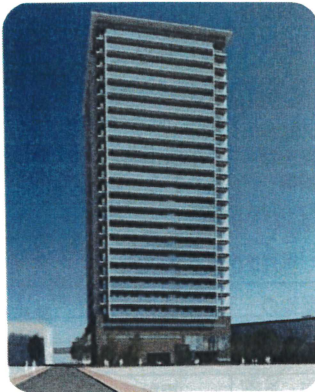
▲戸越5丁目19番地イメージ図