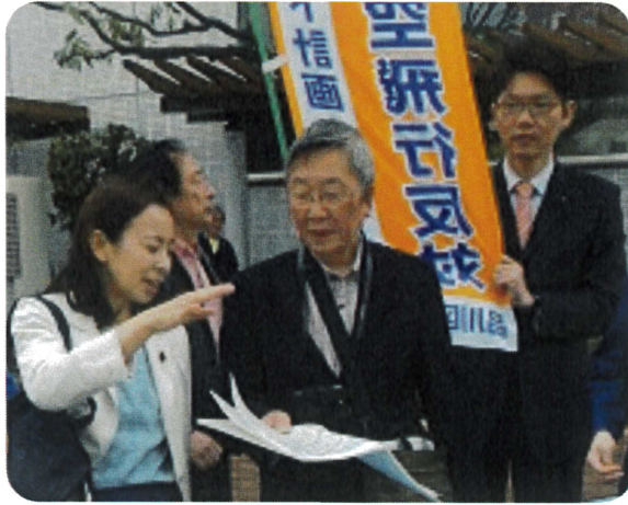
▲4月6日、共産党の吉良よし子参院議員が羽田新ルート計画の現地調査を行いました。住民の会と懇談。国会とも連携し計画撤回へ声を上げよう。