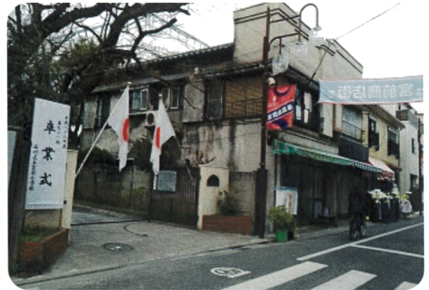
▲宮前小学校、戸越台中学校の卒業式と入学式に参加しました（写真は昨年のも）。子どもたちは元気でしたが、卒業式では欠席もありました。もっと子どもが希望を持てる社会にしていきたい。