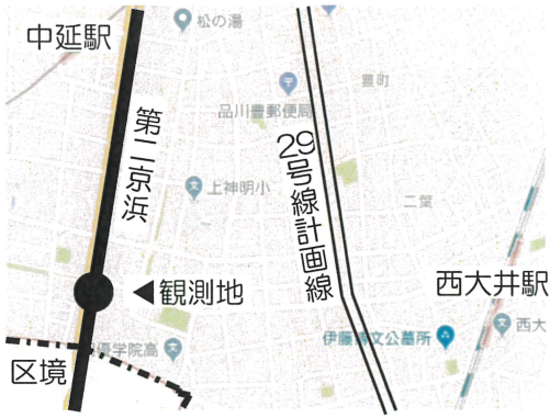
■自転車交通量の推移(台/12時間)【観測地】西大井6-1【調査日】H26/6/3(火)【天候】晴

東京都の「平成27年度道路交通センサス」では29号線に並行して走る第二京浜は5年前より1720台/12h減少しています(下表)。交通量が減っている中でまちを壊して新たな道路をつくる必要はありません。防災だけでなく交通の円滑化にも道理がないことが浮き彫りになりました。