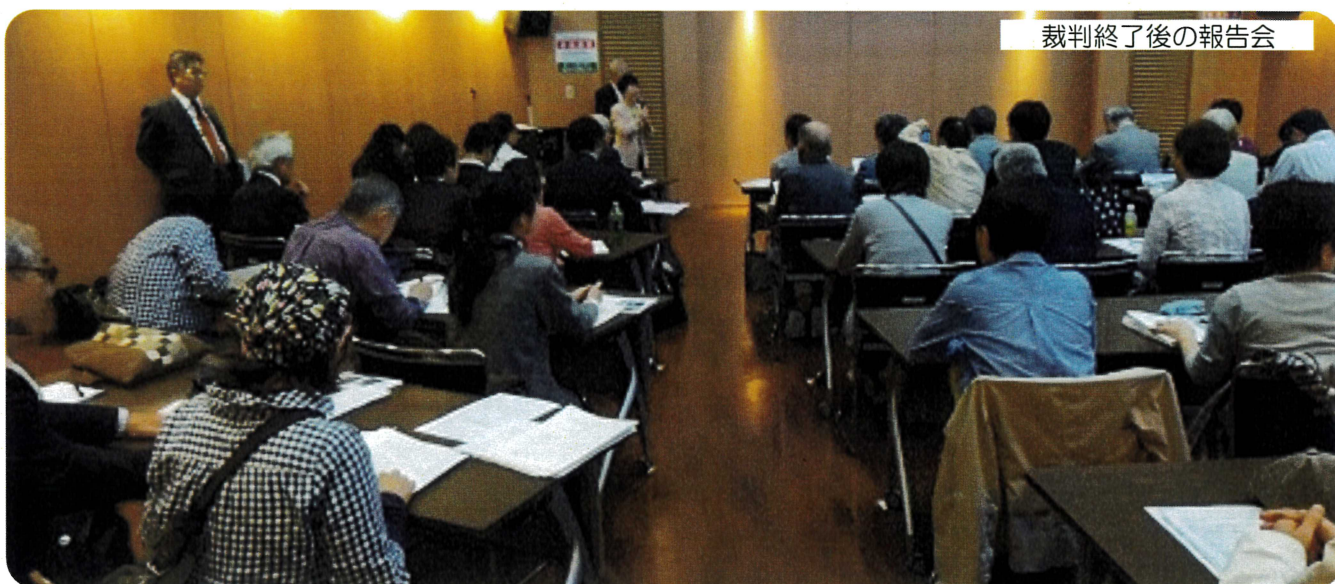
裁判終了後の報告会

4月23日、第3回29号線認可取り 消し裁判が開かれました。多くの傍 聴者が駆けつけ、西大井在住の方が 意見陳述を行いました。