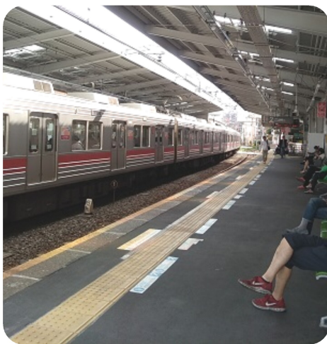
▲現在の戸越公園駅ホーム

再び悲劇を出さないためホームドア設置で誰もが安全に利用できる公共交通を実現させましょう。