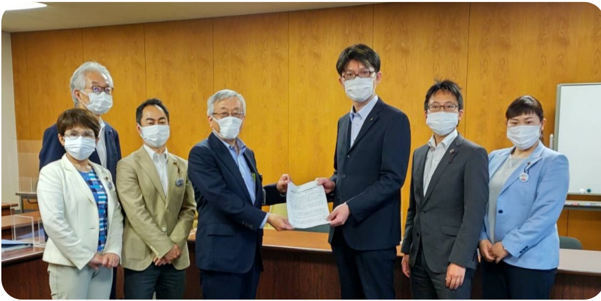
▲5月18日、品川区に新型コロナワクチンに関する緊急要望を提出。総務部長が対応。希望する区民がスムーズにワクチン接種できるよう求めました（詳細は裏面参照）。

新型コロナウイルス接種の予約受付で「電話もインターネットも繋がらない」「インターネット予約の操作がわからない」など大混乱が起きています。