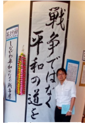
しながわ平和のため の戦争展にて