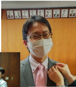
当選後議員記章 を受け取り