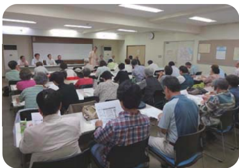
八潮の方が「迫ってくる恐怖を感じた」と体験を発言、報告会は46人参加