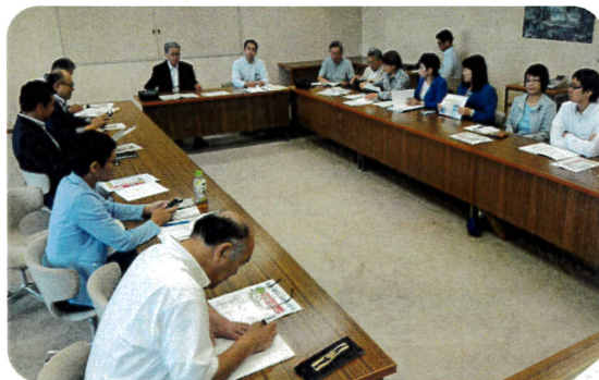
▶ 現地調査後、住民の皆さんと懇談会

月には民家の屋根に穴が開く事件が起きたが、落下物と思われる氷塊を国土交通省の職員が確認できなかった。カウントされなかった。人口の多い都心では落下物による人命へのリスクはより高い」と話します。