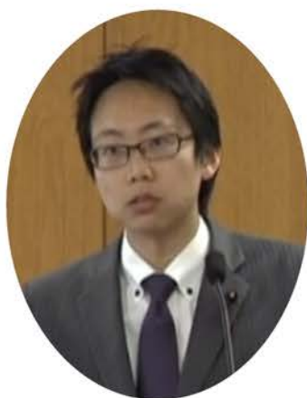
予算総括質問をする様子

引続き羽田新ルートの中止を求めるとともに賛否を問う区民投票の成功へ全力を尽くします。