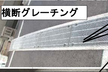
横断グレーチング