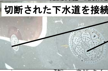
切断された下水道を接続