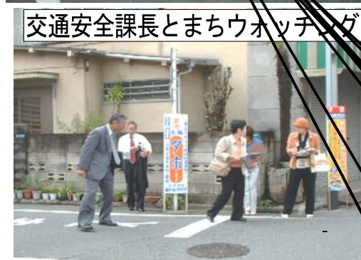
交通安全課長とまちウォッチング