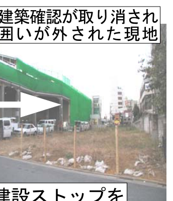
建築確認が取り消され 囲いが外された現地