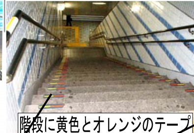
荏原中延駅エレベーター