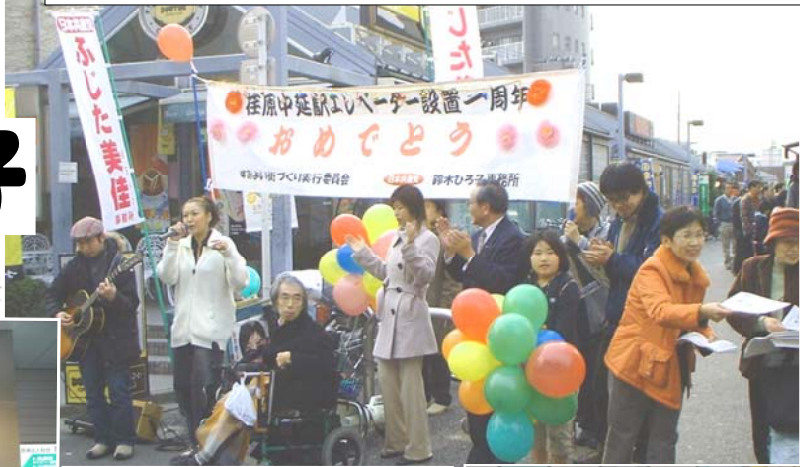
荏原中延駅、エレベーター実現1周年記念路上ライブ