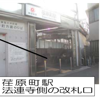
荏原町駅 法蓮寺側の改札口