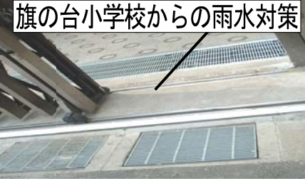
旗の台小学校からの雨水対策