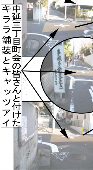
中延三丁目町会の皆さんと付けた キララ舗装とキャッツアイ