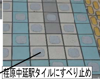
荏原中延駅タイルにすべり止め