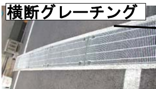
横断グレーチング