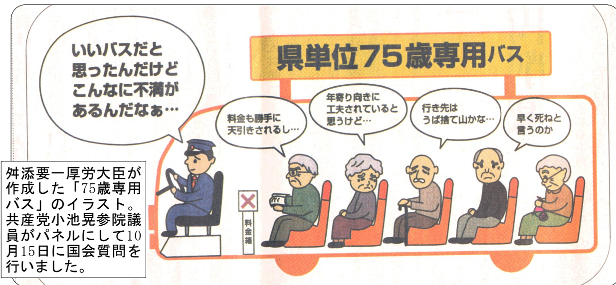
大臣が作成した「75歳専用バス」のイラスト。議員がパネルにして10月15日に国会質問を行いました。

後期高齢者医療制度、品川区でもいよいよ10月15日から、年金からの保険料天引きが始まりました。「年金は同じなのに何でこんなに引かれるのか!」高齢者に怒りと不安と混乱が渦巻いています。こんな制度は廃止しかありません。