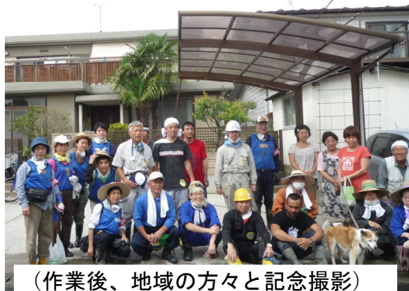
(作業後、地域の方々と記念撮影)