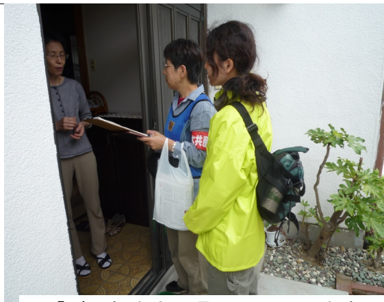
(「ご要望を市や県、国に届けます」と3人1組で1軒1軒訪問)