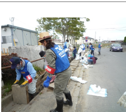
(南区議とペアーで側溝のヘドロ出し。左が南区議、右が私です)