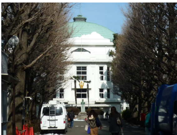
星薬科大学（放射2号線は正面の建物のすぐ前を貫き、構内を分断する計画）