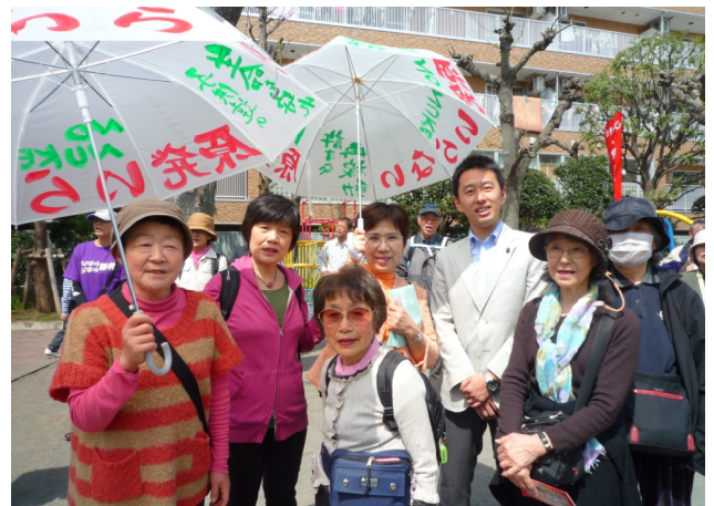
中延や旗の台地域からもたくさんの方が参加

中延2-11-7 3783-8833 弁護士さんが対応します。 遺産相続や借金、離婚、医療や介護、どんな問題でもお気軽に。