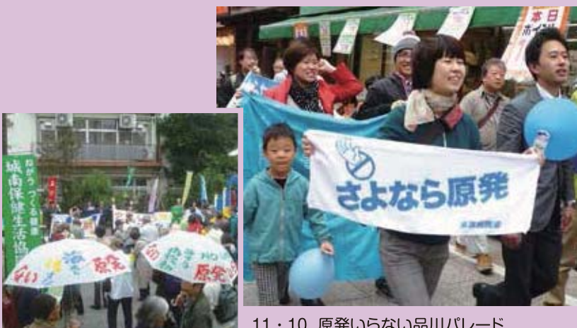
11・10 原発いらない品川パレード