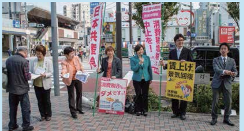
共産党区議団と白石たみお都議(大井町駅前)