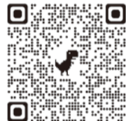
▲アンケートの詳細な結果はこちらから