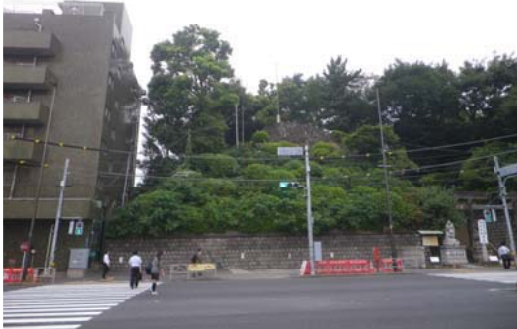
(上) 裏の崖地に避難勧告が出された品川神社。