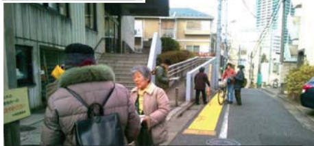
図書館前での署名の呼びかけには、子連れママなど大半の利用者が協力していました（1/31）

を手に取り選ぶことや、読み聞かせ会など本を通しての交流、地域文化を発信するなど、本来図書館が果たすべき役割は果たせません。 ●「移転」後の活用は、反対運動が続いている道路・29号線の代替地、と説明されています。道理のない道路を通すため、移転の必要ない区立図書館を移すとは、ひどすぎます。 【結論】御殿山小西側には「移転」でなく図書館の新規開設を。29号線は中止し大崎図書館は必要な補修を行い現地存続。2階スペースも活用し更に良い施設へしていくべきです！