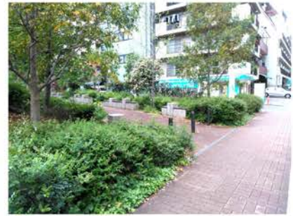
当初トイレが建つ予定だった場所の現況写真