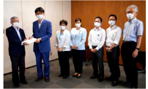
28項目にわたる新型コロナ対策の緊急要望書（第四弾）を提出（7/22）