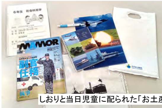
しおりと当日児童に配られた「お土産」

保護者を通して、ある区立学校の6年生の社会科見学で7月、防衛省を見学したことが分かりました。