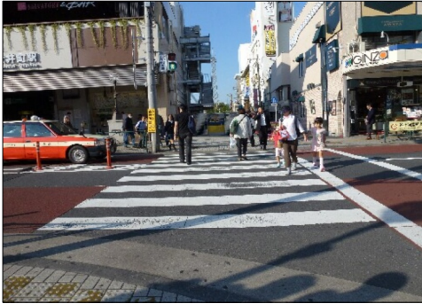
音響信号のある横断歩道です

視覚障害者が外で安全に行動するには、白杖と音が頼りです。白杖は歩くときに点字ブロックを確認するために必要ですし、音は車が来るのかどうか、来る方向を確認するのです。横断歩道で鳴る音楽は一人で横断するときには必要です。ところが周辺の音にかき消されて聞こえない