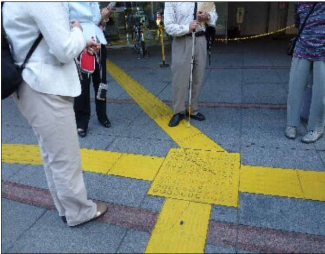
駅周辺で調査を始めた視覚障害者と区議団

9月28日、視覚障害者の方たちと大井町駅周辺の信号機や横断歩道などを、障害者にとって歩きやすい状況が確保されているのかチェックをしました。たくさんの問題点がありました。