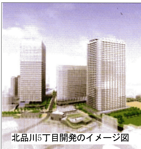
北品川5丁目開発のイメージ図

4月16日の行政改革特別委員会で、御殿山小学校西側敷地の活用計画について報告がありました。計画には老健施設と文化施設を予定していますが、文化施設とは大崎図書館の移設だと説明。移設ではなく増設こそでしょう。