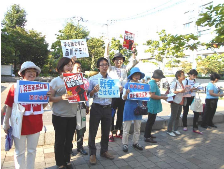
区議会議員有志(10人)で品川パレードに参加

9月13日、「戦争法案 絶対反対!」を力強くコールして、区役所前から大井町駅を超えてすずらん通りの浅間台公園まで400人の区民がデモ行進をしました。沿道を通行する方たちの多くは、「私たちも同感です。ガンバッテ」とばかりに「エール」を感じました。最後まで「廃案」求め頑張りました。