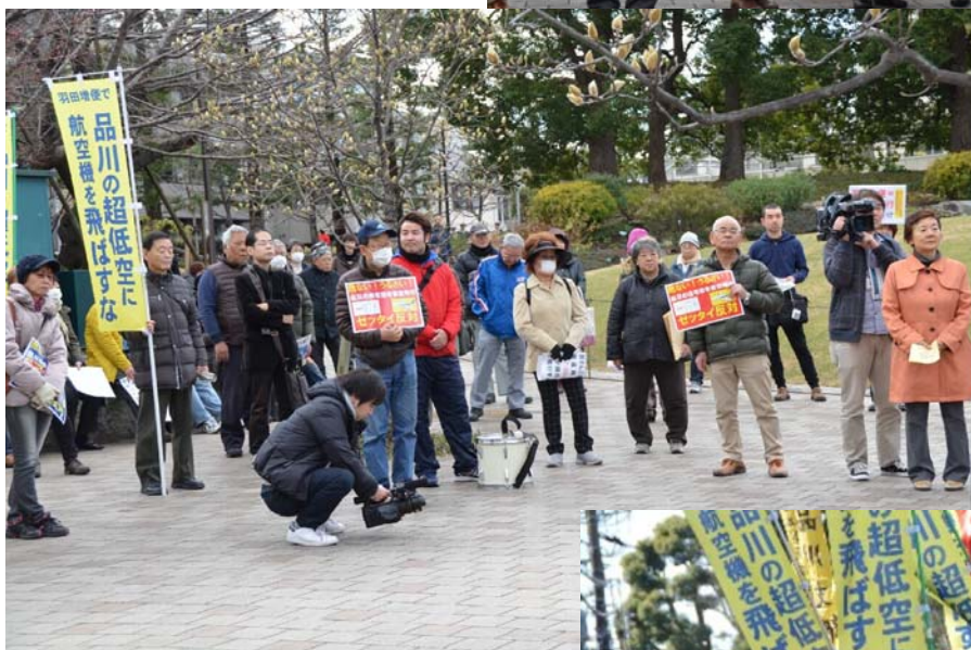
集会参加者のみなさん