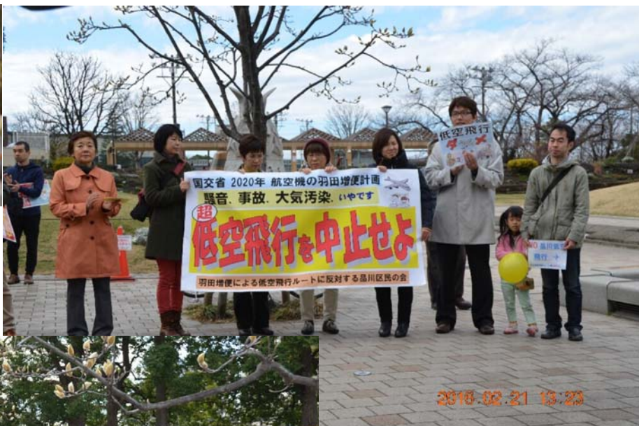
上の写真は、中央公園に駆け付けた共産党議員団とネットの議員（左端の方）