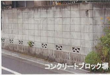
コンクリートブロック塀