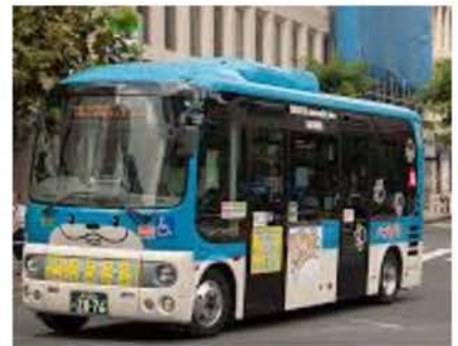
渋谷区を走る「ハチ公バス」

コミュニティバス路線の導入へ、品川区議会では区民から何度も請願署名が提出されました。これまで賛成は共産、ネット、無所属のみで、請願署名は否決になりましたが、導入を求める強い区民世論が力となり、ようやくここまで検討を進める事ができました。移動に便利なコミュニティバス路線の実現へ、引き続き頑張ります。