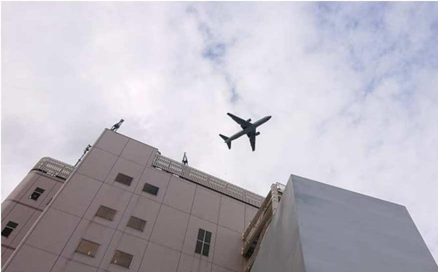
大井町駅アトレを低空飛行。立ち止まり見上げる方も、よく見られます。

「慣れるどころかストレス増えるばかり」 さらさらに強まる 羽田新ルート中止を求める声