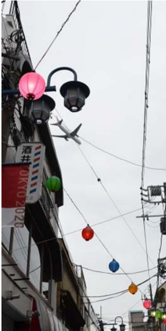
商店街の上を通過する航空機 の姿（立会川駅付近）