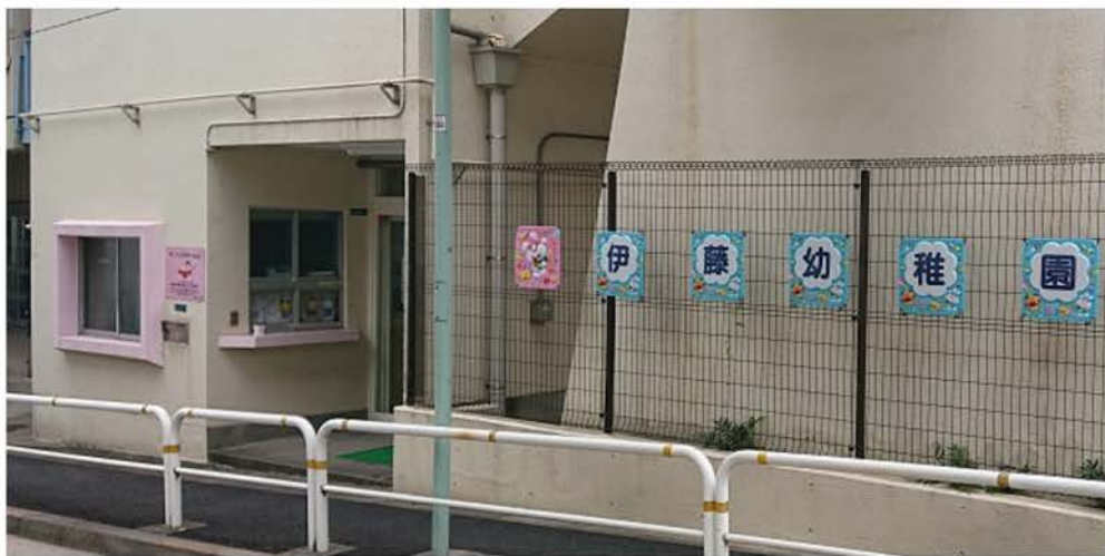
伊藤小学校から体育館への渡り廊下先にある、区立伊藤幼稚園（西大井5丁目）。