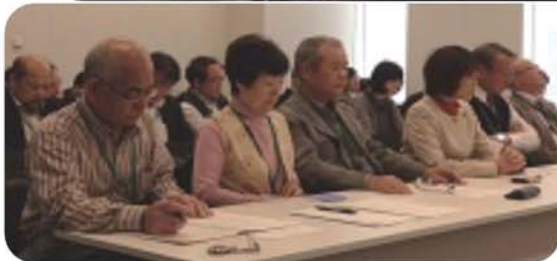
↑ 共産党の田村智子参議員も参加 (前列左から4人目)。合計30名が参加。

経産省は商店街が壊されることに「何なんだこの計画は」と必要に応じ、国交省に意見を言うといいました。縦割り行政のゆがみが現れています。29号線などを含む特定整備路線により全国でも有名な「ハッピーロード 大山商店街」「十条商店街」「戸越銀座商店街」が分断されます。