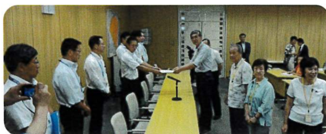
▲国交省が都市計画道路の見直しを推進するとの発表を受け29号線など撤回を求める道路連絡会が東京都と交渉を行いました。国は事業化された路線も見直し対象としているにもかかわらず、都は事業化路線を対象から外し、一部の見直しにとどまり道路ありきの姿勢に固執していることが浮き彫りになりました。都の住民を顧みない答えに参加者一同怒りを強めました。