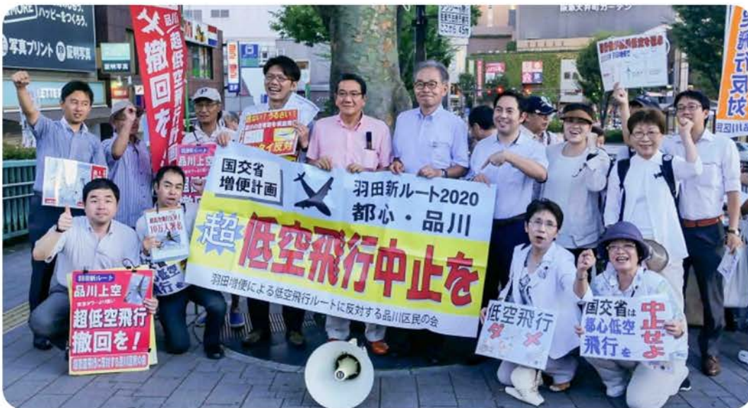
▲8月26日、区民の会の宣伝に超党派で参加。

羽田低空飛行ルートの撤回を求め る運動が超党派で広がっています。 超党派で宣伝、パレード 羽田増便による低空飛行ルートに 反対する品川区民の会を中心に計画