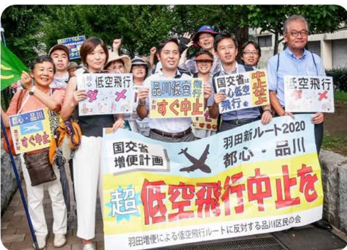
▲7月22日に行われた第14回新ルートに反対するアピールパレード出発前の様子。

羽田低空飛行ルートの撤回を求め る運動が超党派で広がっています。 超党派で宣伝、パレード 羽田増便による低空飛行ルートに 反対する品川区民の会を中心に計画