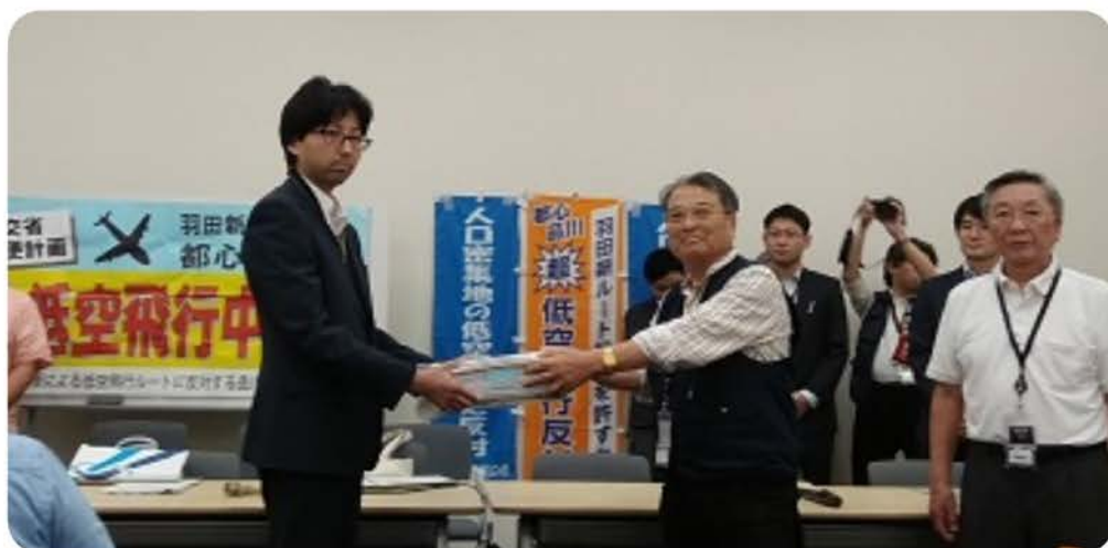
▲当日は約3千筆の署名を手渡し、合計30620筆に達しました。

6月24日、教室型説明会を行い、計画をやめてほしいとの声が続出する中で、国交省の認識を問いました。 国交省も理解が得られていないことを認める 今後の日程について国交省は明確